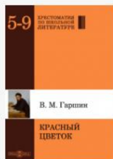
Красный цветок: худ