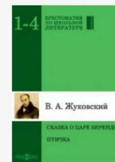
Сказка о царе Берен